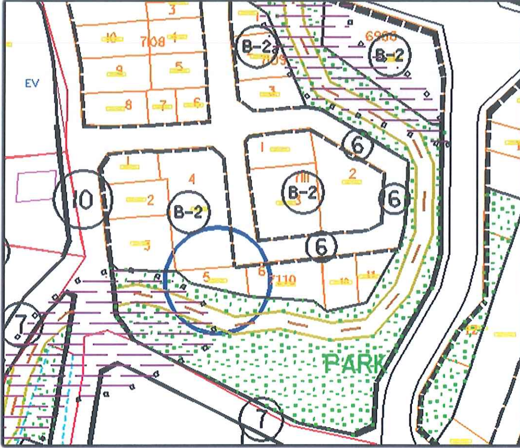
Şekil 2: Onaylı UİP örneği