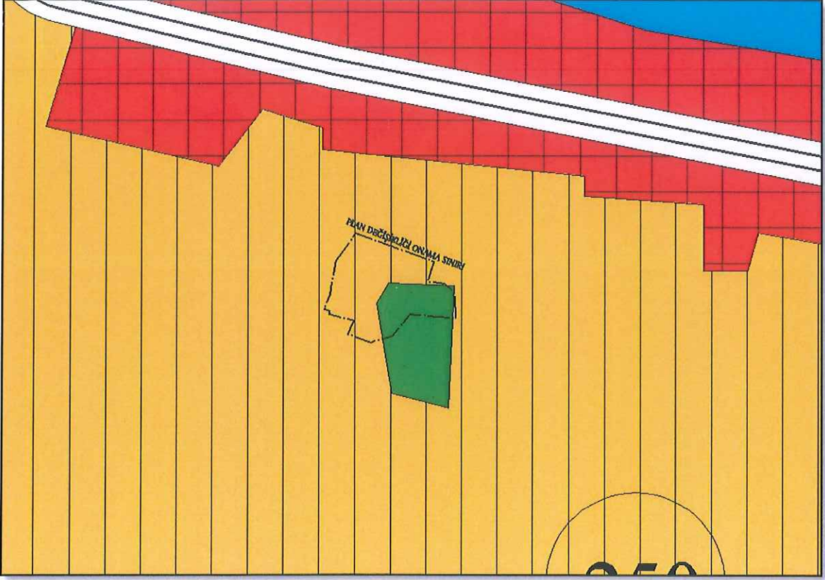
Şekil 1: NİP örneği